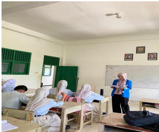
Gambar 3. Mahasiswa PLP menyampaikan materi di kelas.

Pada saat praktik mengajar berlangsung, mahasiswa juga belajar mengelola perhatian siswa. Ada peserta didik yang langsung mengikuti arahan, ada yang masih berbicara dengan teman, dan ada yang menunggu contoh sebelum bergerak. Kondisi seperti ini tidak dapat dihadapi hanya dengan teori. Mahasiswa perlu mengambil keputusan kecil di kelas, misalnya mengulangi instruksi, mendekati kelompok tertentu, atau memberi contoh tambahan. Hasanah dan Indrawati (2024) menjelaskan bahwa microteaching dan pengalaman lapangan mendukung kesiapan menjadi guru. Hal ini tampak dalam PLP karena keberanian mahasiswa untuk mengajar tumbuh melalui percobaan, arahan guru pamong, dan refleksi setelah kegiatan.