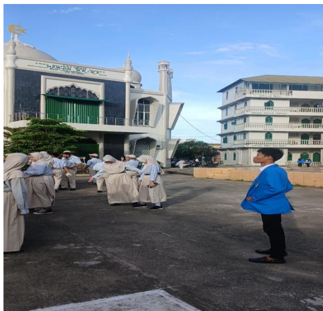
Gambar 1. Lingkungan SMA Pembina Palembang sebagai tempat pelaksanaan PLP.

kegiatan ekspresi tubuh. Pengenalan lingkungan sekolah membantu mahasiswa memahami budaya sekolah, termasuk kedisiplinan, pola komunikasi, dan kebiasaan peserta didik. Kartikawati et al. (2022) menjelaskan bahwa PLP memberi pengalaman awal bagi mahasiswa untuk memahami suasana persekolahan secara langsung. Alif dan Triatmaja (2022) juga menempatkan PLP sebagai proses pengenalan terhadap lingkungan sekolah, sementara pedoman Universitas Negeri Surabaya (2023) menegaskan pentingnya keterlibatan mahasiswa dalam observasi dan adaptasi dengan sekolah mitra. Pada konteks SMA Pembina Palembang, observasi lingkungan membuat mahasiswa lebih siap menyesuaikan pembelajaran seni dengan ruang yang tersedia dan kebiasaan sekolah.