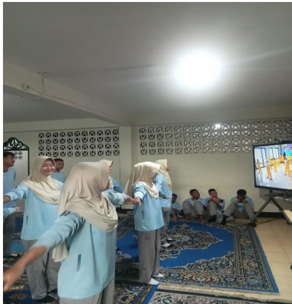
Gambar 5. Peserta didik mengikuti praktik seni pertunjukan di ruang belajar..

Aktivitas seni pertunjukan juga melatih keberanian dan kebersamaan. Peserta didik yang awalnya ragu dapat mulai bergerak ketika melihat teman sekelompoknya mencoba. Dalam pembelajaran vokal, Satiawan et al. (2021) menunjukkan bahwa praktik unisono dapat membangun kekompakan dan pengalaman musikal peserta didik. Meskipun konteksnya berbeda, prinsip tersebut relevan dengan praktik gerak di SMA Pembina Palembang: siswa belajar melalui kebersamaan, pengulangan, dan kepercayaan diri untuk tampil di hadapan teman.