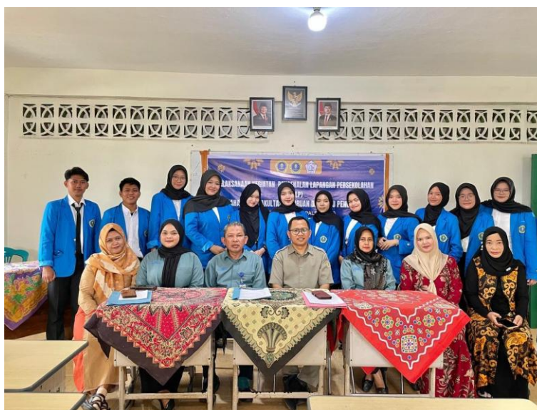
Gambar 8. Dokumentasi mahasiswa PLP bersama pihak sekolah dan dosen pembimbing

Refleksi bersama guru pamong dan dosen pembimbing membantu mahasiswa melihat praktik mengajar secara lebih objektif. Masukan dari guru pamong dapat berkaitan dengan cara mengelola kelas, bahasa yang digunakan, atau pengaturan waktu. Dosen pembimbing membantu mahasiswa mengaitkan pengalaman lapangan dengan teori kependidikan. Hasanah dan Indrawati (2024) serta Wulanndari et al. (2024) menunjukkan bahwa pengalaman lapangan mendukung kesiapan dan kompetensi pedagogik calon guru. Dengan demikian, PLP di SMA Pembina Palembang memberi pengalaman yang memperkuat identitas mahasiswa sebagai calon guru seni pertunjukan.