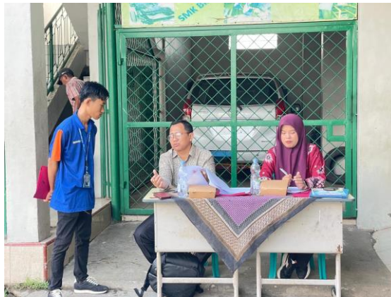
Gambar 2. Koordinasi mahasiswa PLP dengan guru pamong dan dosen pembimbing.

Koordinasi dengan guru pamong juga menjadi ruang belajar yang penting karena guru lebih memahami karakter peserta didik. Mahasiswa dapat memperoleh gambaran tentang kelas yang aktif, kelas yang membutuhkan arahan lebih banyak, atau kondisi siswa yang perlu didekati dengan cara tertentu. Arahan seperti ini membantu mahasiswa menyiapkan instruksi yang lebih jelas, memilih media yang sesuai, dan mengatur tempo pembelajaran. Dengan demikian, hubungan antara mahasiswa PLP, guru pamong, dan pihak sekolah menjadi dasar agar praktik mengajar dapat berlangsung lebih terarah.