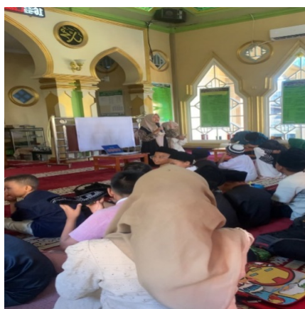
Gambar 1. Penyampaian Materi Edukasi Anti-Bullying kepada Santri TPQ Perkembangan Empati Santri

Peningkatan pemahaman tersebut sejalan dengan hasil penelitian Niriyah et al. (2024) dan Yasmin et al. (2023) yang menunjukkan bahwa program edukasi bullying mampu meningkatkan pengetahuan peserta secara signifikan setelah diberikan penyuluhan dan pendampingan