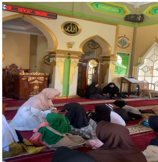
Gambar 2. Sesi Diskusi dan Refleksi Nilai-Nilai Islam dalam Pencegahan Bullying

Materi edukasi yang dipadukan dengan nilai-nilai Islam memperoleh respons yang baik dari santri. Pembahasan mengenai QS. Al-Hujurat ayat 11 tentang larangan mengejek, menghina, dan merendahkan orang lain memberikan pemahaman bahwa bullying bertentangan dengan ajaran Islam. Santri menunjukkan antusiasme saat menghubungkan materi bullying dengan kehidupan sehari-hari di lingkungan TPQ. Pendekatan religius ini membantu peserta memahami bahwa menghormati dan menyayangi sesama merupakan bagian dari akhlak mulia yang harus diterapkan dalam kehidupan sehari-hari. Temuan ini sejalan dengan penelitian Rizqi et al. (2024) yang menjelaskan bahwa nilai-nilai Islam dapat menjadi fondasi dalam membangun lingkungan belajar yang aman, inklusif, dan bebas dari perilaku perundungan.