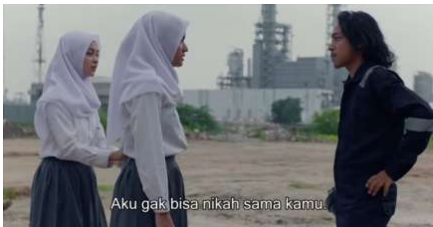
Gambar 2 – Penolakan Lamaran

Temuan tersebut sejalan dengan penelitian Febiola et al., (2022) yang menjelaskan bahwa adegan lamaran dalam film Yuni menunjukkan bagaimana perempuan ditempatkan sebagai objek keputusan keluarga melalui budaya patriarki yang lebih mengutamakan pernikahan daripada pendidikan.