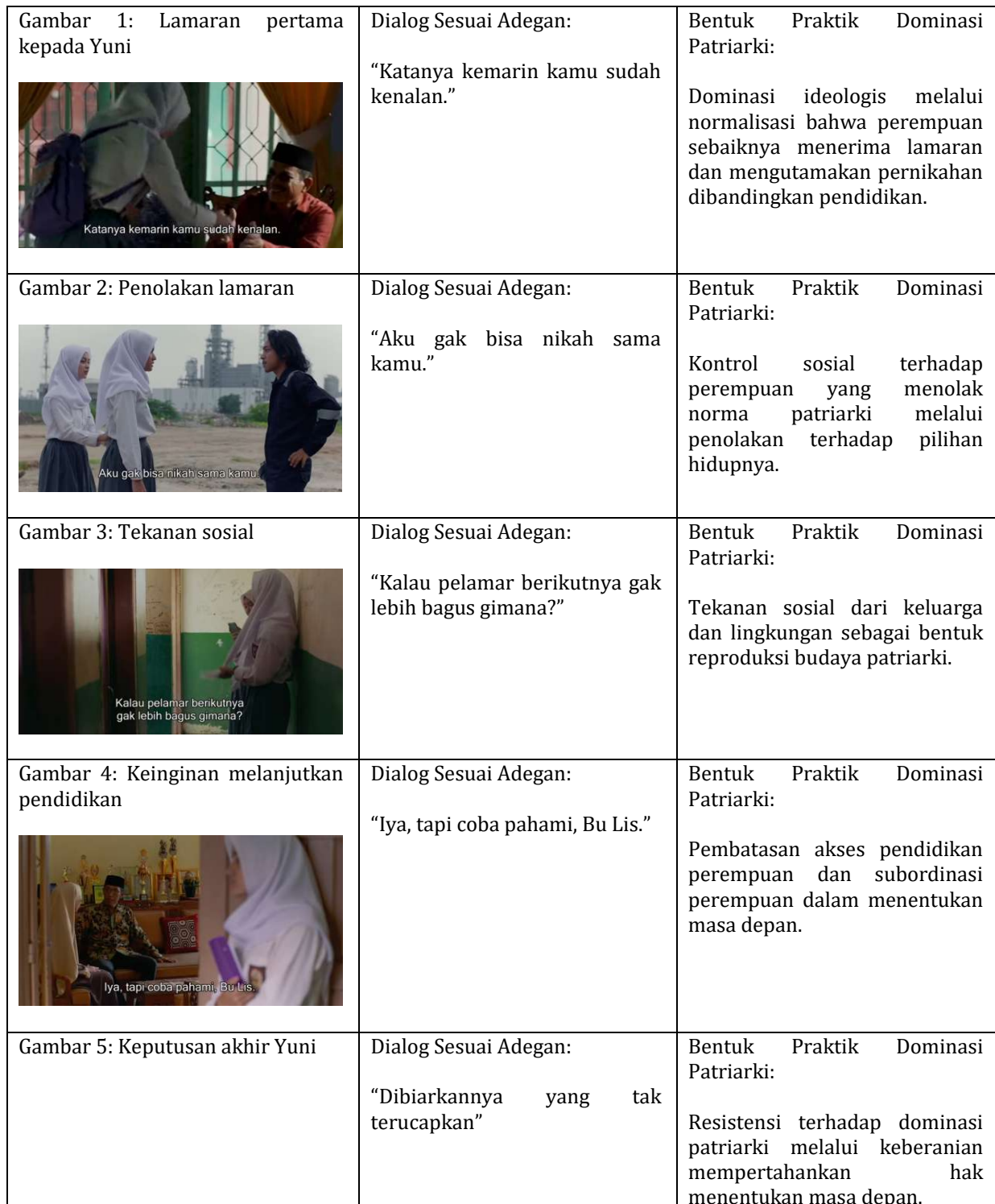
Tabel Unit Analisis Penelitian

praktik budaya, serta memahami proses pembentukan makna yang berkaitan dengan relasi kuasa dalam film Yuni. Pemilihan kelima scene tersebut didasarkan pada pertimbangan bahwa setiap adegan menampilkan bentuk praktik dominasi patriarki yang berbeda sehingga mampu memberikan gambaran yang lebih komprehensif mengenai mekanisme dominasi patriarki yang berlangsung dalam film Yuni.