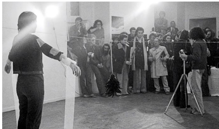
Gambar 1: Pertunjukkan Rhythm 0 oleh Marina Abramović

Marina Abramović merupakan seniman kontemporer asal Serbia yang mendedikasikan praktis artistiknya pada seni pertunjukan ( performance art ) sebagai media ekspresi visual utama. Bagi Abramović, seni pertunjukan adalah sebuah perwujudan fisik dan mental yang dikonstruksi oleh seniman di hadapan publik dalam ruang dan waktu tertentu untuk menciptakan dialog energi yang intens (Abramović, 2015). Dalam setiap karyanya, Abramović secara konsisten memosisikan tubuhnya sendiri sebagai objek sekaligus medium utama dari karya seninya. Melalui eksplorasi batas fisik dan mental yang ekstrim, ia mengkonfrontasi rasa sakit, lelah, dan risiko bahaya sebagai upaya mencapai transformasi emosional serta spiritual. Fenomena ketahanan tubuh manusia terhadap rasa sakit dan spektrum perilaku moralitas manusia merupakan substansi seni yang diklasifikasikan oleh Abramović sebagai "seni immaterial", yaitu sebuah bentuk kesenian tertinggi kedua setelah spiritualitas.