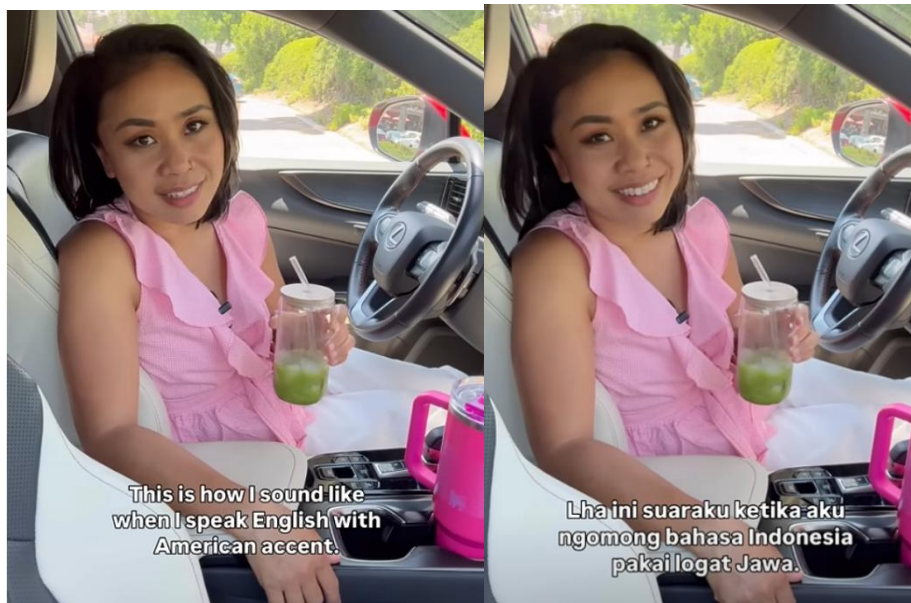
Gambar 4.2.3. translanguaging