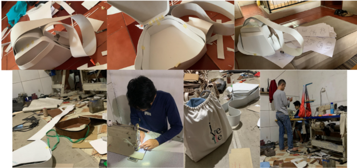
Gambar 4. Dokumentasi proses pembuatan Make Up Travel Bag (pemotongan bahan, perakitan, dan finishing)

Tahapan yang didokumentasikan meliputi proses pemotongan bahan sesuai pola, penyusunan dan pemasangan kompartemen, pemasangan resleting, serta tahap finishing untuk menyempurnakan tampilan dan fungsi produk. Seluruh dokumentasi proses produksi tersebut disajikan pada Gambar 4 sebagai ilustrasi pelaksanaan pembuatan Make Up Travel Bag.