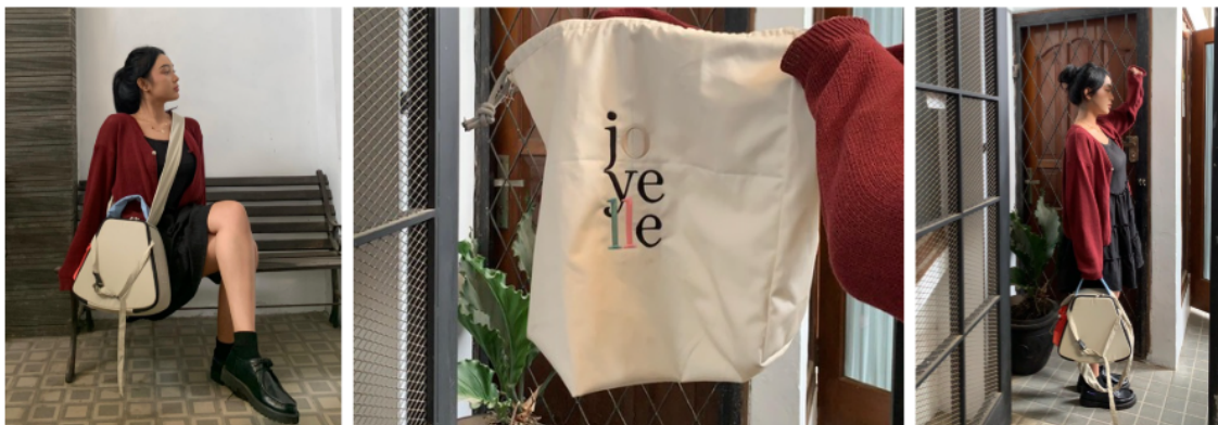
Gambar 3. Prototipe Make Up Travel Bag hasil jadi dan simulasi penggunaan saat bepergian

Untuk memberikan gambaran yang lebih jelas mengenai proses pembuatan produk, dilakukan dokumentasi pada setiap tahapan produksi. Dokumentasi ini bertujuan untuk