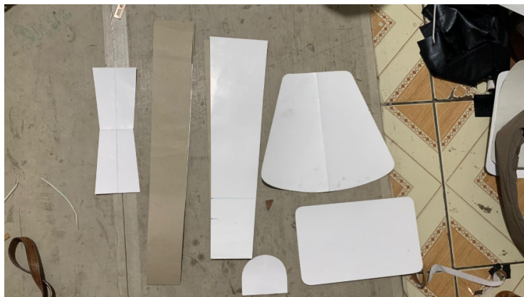
Gambar 2. Pola Dasar Pembuatan Make Up Travel Bag

Selanjutnya, pola dasar digunakan sebagai acuan dalam proses pemotongan material dan perakitan komponen tas. Penggunaan pola membantu memastikan setiap bagian tersusun dengan baik serta mempermudah proses produksi agar menghasilkan produk yang sesuai dengan desain yang direncanakan. Pola dasar yang digunakan dalam tahap realisasi desain ditampilkan pada Gambar 2.