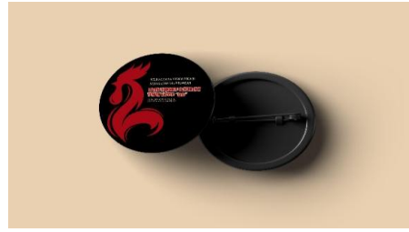
Gambar 17. Pin