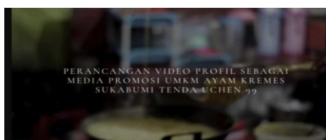
Gambar 1. Opening Video Profil UMKM Ayam Kremes Sukabumi

Ukuran video profil dipilih karena ukuran tersebut memudahkan proses upload video pada semua platform digital.