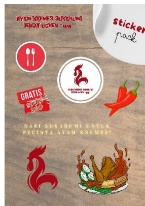
Gambar 15. StickerPack