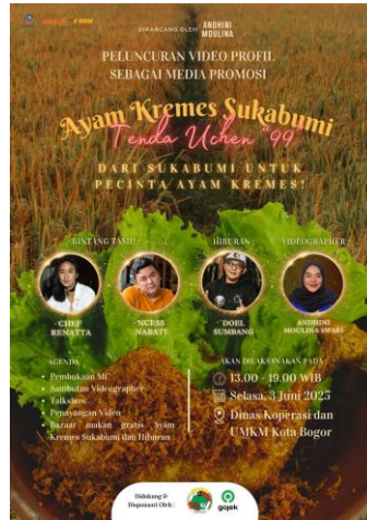
Gambar 6. Poster Peluncuran