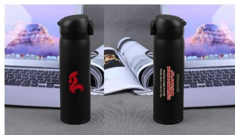
Gambar 16. Tumbler