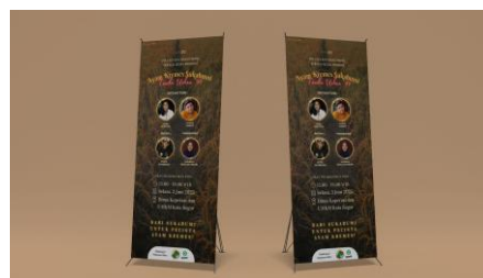
Gambar 9. X Banner Mockup