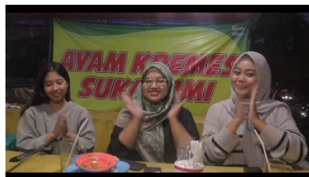
Gambar 4. tampilan video yang sudah diberi color grading

menggunakan warna yang cerah dan menarik untuk memperkenalkan profil UMKM dan meningkatkan visibilitas outlet di kalangan masyarakat. Warna cerah seperti kuning, merah, dan hijau sering digunakan dalam promosi kuliner untuk menarik perhatian dan menciptakan suasana yang menyenangkan.