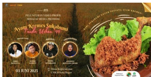
Gambar 11. Billboard