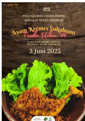
Gambar 12. Flyer A5