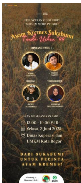
Gambar 10. Design X Banner