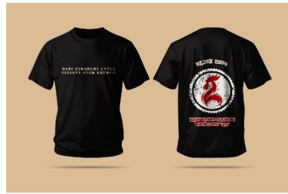
Gambar 13. T-Shirt