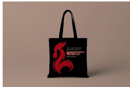
Gambar 14. Totebag