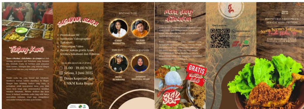
Gambar 7 & 8. Tampak Depan dan Belakang Brosur