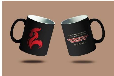
Gambar 18. Mug